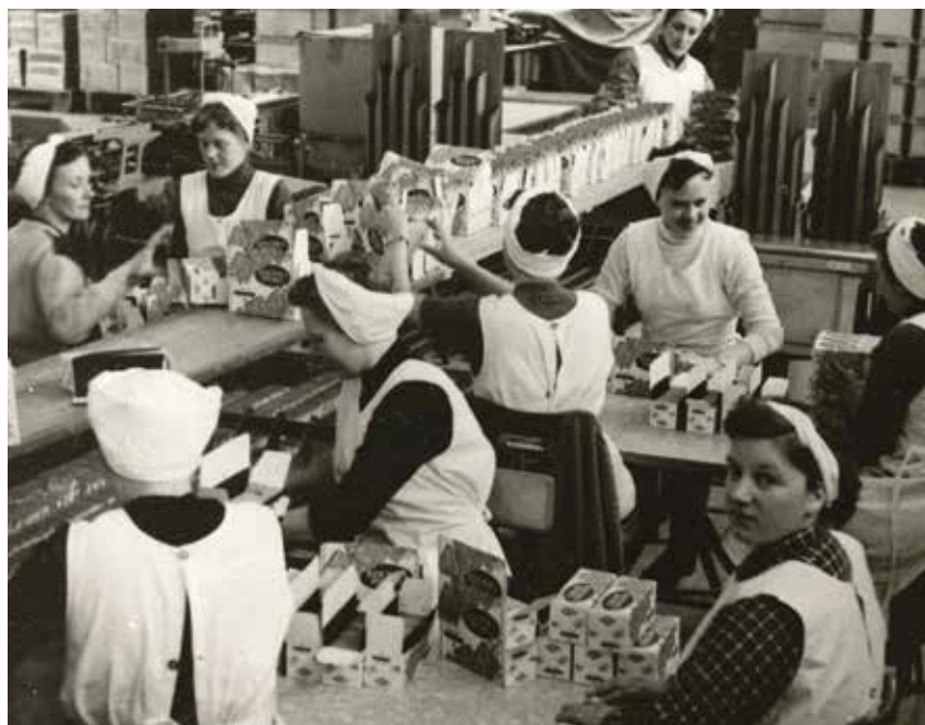
Fra en af byens stolte virksomheder, Kiksefabrikken Oxford. Ca. 1954.

I udstillingen vil vi slutte af med at spørge om, hvad vi skal være stolte af i Hjørring lige nu? Vi vil her invitere kendte hjørringensere til at give deres bud forud for åbningen, men i udstillingen vil museets daglige besøgende også selv kunne bidrage. Udstillingen peger således også fremad: Hvilke gode historier fortjener at komme på museum i fremtiden og hvad skal kommende generationer huske nutidens Hjørring for? ■