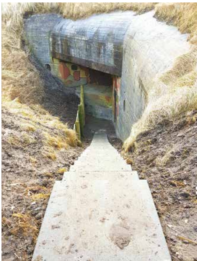
Trappen til artilleriobservationsbunkeren har fået en ansigtsløftning samt afskærmning, så der ikke igen skrider jord og sand ned over trappen.

2018 bliver endnu et travlt år i Bunkergruppen Hirtshals, og vi glæder os til at fortsætte det super gode samarbejde, vi har med Vendsyssel Historiske Museum. ■