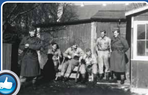
Hjørring flygtningelejr, efterår 1945.