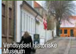
Vendsyssel Historiske Museum