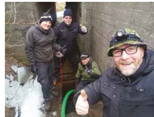
I vand til anklerne kan ikke gøre det på Bunkermuseet Hirtshals. Store mængder vand forsøges kommet til livs.