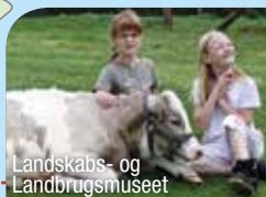
Landskabs- og Landbrugsmuseet