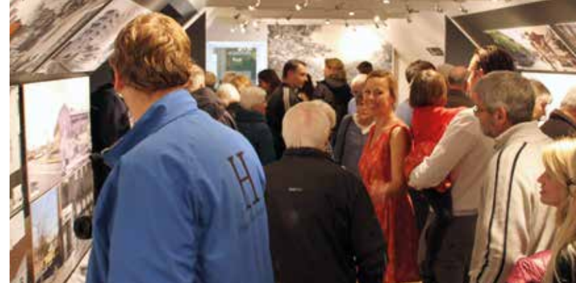
Fra udstillings- åbningen på "Hjørring i Tidsmaskinen", den 10. oktober 2015.

Man ser mange spændende kontraster i billederne, ikke blot hvordan bygninger og gader har ændret sig, også mennesker, transport og andet byliv giver gode detaljer. Det har været et meget interessant projekt at arbejde på, og som lokal