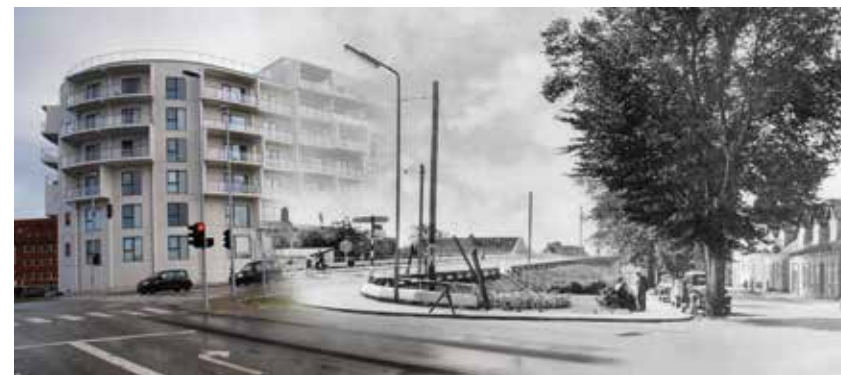
Et mash-up af Bispensgade- broen, fra henholdsvis ca. 1957 og 2015.

får man både hukommelsen og fantasien vækket. Det sætter tanker i gang om, hvordan det var at gå rundt i Strømgade i 1910 kontra nu – og ikke mindst, hvordan det mon bliver i fremtiden.