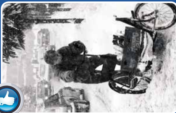
Bybud på Lang John i snevej, ca. 1985.