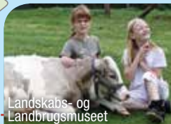
Landskabs- og Landbrugsmuseet