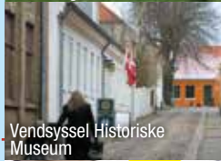
Vendsyssel Historiske Museum