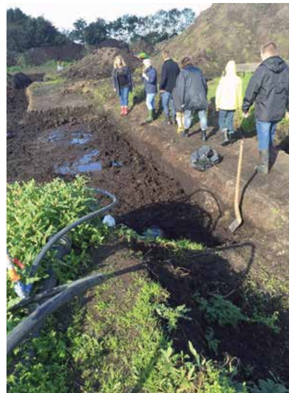
Her rundviser jeg en gruppe besøgende, der valgte at bruge deres lørdag formiddag i mosen.