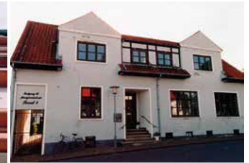
Nederst th: Østergade 30, Hjørring, 2003.