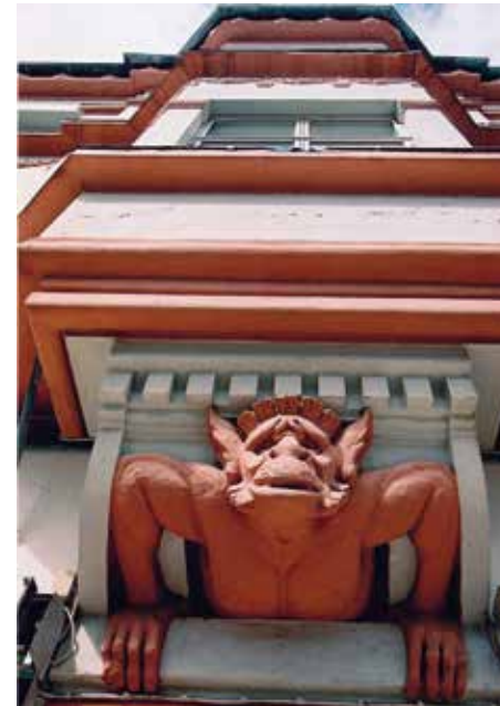
Tv.: Detalje fra Jernbanegade 13, Hjørring, 2004.

I projektets seneste år er der ud over bygningsfacaderne også foretaget en