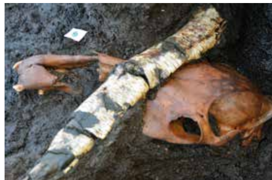
Hestekranie holdt fast af birkegren.

lebunker og lerkar ser ud til derefter at være anbragt i disse nedgravninger – holdt nede af grene i de mere eller mindre åbentstående vandhuller. Med tiden er mosens åbne vand vokset til med mosser, som har dannet den brune mostørv, der indtil for nylig har holdt på de velbevarede kranier og knogler. Hvordan skal fundene så tolkes? Det står klart, at der ikke kan være tale om egentlige begravelser. Der er ikke fundet spor af underkæber, løse tænder, halshvirvler eller andre legemsknogler fra de seks mennesker. Derfor kan der næppe heller være tale om fund, der kan sammenlignes med de kendte moselig som Grauballemanden og Tollundmanden. Vi ved også, at man almindeligvis i jernalderen begravde de døde i jorden på større og mindre gravpladser. Meget tyder derimod på, at kranierne er lagt ned i mosen nogen tid efter, at de seks personer døde. Måden, kranierne er anbragt på med lerkar og grene, peger på ofringer og ritualer. Præcise dateringer af kranierne vil vise, hvor lang tid mosen er blevet brugt til sådanne ofringer, for de seks kranier ligger i forskellig dybde og er derfor måske ikke samtidige. ■