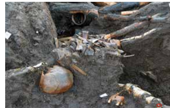
Udsnit af nedgravningerne med menneskekranier, hestekranier, knoglebunker og lerkar.