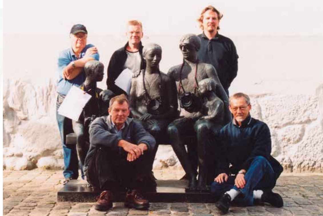
Medlemmer af Hjørring Fotoklub, 2004.

(Uddrag af artiklen: Human remains and conservators, Årsberetning 2012 for Bevaringscenter Nordjylland. Oversat af Peter Gravers, lettere redigeret og suppleret af Per Lysdahl)