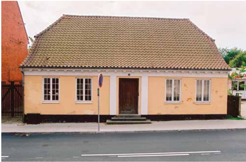
Skolegade 11, Hjørring, 2004.

»Hjørring Fotoklub har tidligere dokumenteret ombygningen af Bechs Klædefabrik til Vendsyssel Kunstmuseum og motorvejsåbningen, ligesom fotoklubben var leverandør af fotos i forbindelse med byens 750 års jubilæum i 1993. Hjørring Fotoklub kan i november 2013 fejre 40 års jubilæum.«